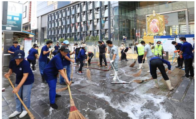
ภาพการร่วมกิจกรรมภายใต้โครงการ “รักษาดู ร่วมใจ ลดภัยฝุ่น”

ณ ถนนราชดำริเชก เขตห้วยขวาง-ดินแดง กรุงเทพมหานคร