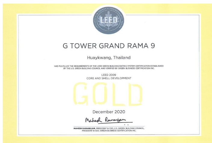
ภาพการรับรองอาคารเขียวมาตรฐานสากลระดับโลก หรือมาตรฐาน LEED อาคารจี ทาวเวอร์ แกรนด์ พระราม 9

โดยในปี 2563 บริษัทฯ ได้รับการรับรองอาคารเขียวมาตรฐานสากลระดับโลก หรือมาตรฐาน LEED: Leadership in Energy & Environmental Design โดยสภาอาคารเขียวสหรัฐอเมริกา (U.S. Green Building Council: USGBC) ระดับ GOLD ในหมวด Core & Shell Development (LEED CS)