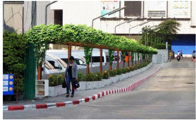
ภาพ Cover Walk Way