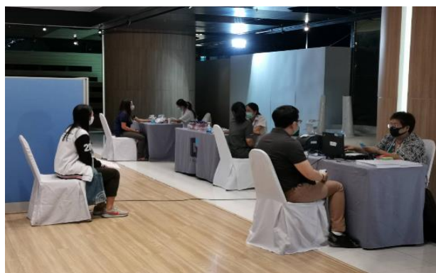
ภาพการรับบริจาคโลหิตของสภาอากาศไทย

ณ โครงการ เดอะไนน์ ทาวเวอร์ส แกรนด์ พระราม 9