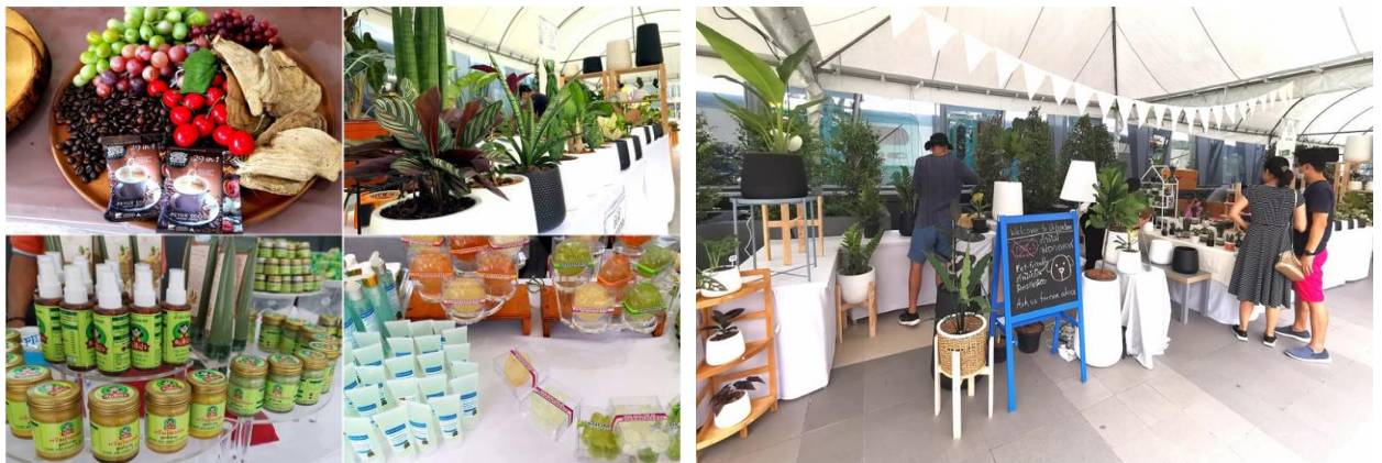
ภาพการจำหน่ายสินค้าและผลิตภัณฑ์ทางการเกษตร โครงการ “FARM TO HOME #SaveFARMER”

นอกจากนี้ บริษัทฯ ยังได้ร่วมกับศูนย์การค้าเซ็นทรัล พระราม 9 จัดทำโครงการ “FARM TO HOME #SaveFARMER” ซึ่งเป็นการจัดสรรพื้นที่โดยไม่คิดค่าใช้จ่ายให้กับเกษตรกรในการจัดจำหน่ายผลผลิตทางการเกษตรที่ได้รับผลกระทบจากสถานการณ์การแพร่ระบาดของโรคติดเชื้อไวรัส COVID-19 ทำให้ไม่สามารถจัดหาช่องทางในการจำหน่ายผลผลิตทางการเกษตรทั้งภายในประเทศและส่งออกไปยังต่างประเทศได้ ส่งผลให้เกิดปัญหาผลผลิตทางการเกษตรล้นตลาด โดยภายในงานได้มีการจัดจำหน่ายสินค้าและผลผลิตทางการเกษตร อาทิ ข้าว พืชผัก ผลไม้ และสินค้าเกษตรแปรรูป เป็นต้น ซึ่งนอกจากการจัดจำหน่ายสินค้าภายในงานแล้ว ยังจัดจำหน่ายสินค้าผ่านช่องทางออนไลน์อีกด้วย การจัดทำโครงการดังกล่าวมีวัตถุประสงค์เพื่อช่วยเหลือ ส่งเสริม และสนับสนุนเกษตรกรที่ได้รับผลกระทบให้สามารถสร้างงาน สร้างอาชีพ สร้างรายได้ และสร้างคุณภาพชีวิตจนสามารถผ่านพ้นสถานการณ์วิกฤตไปได้ด้วยดี