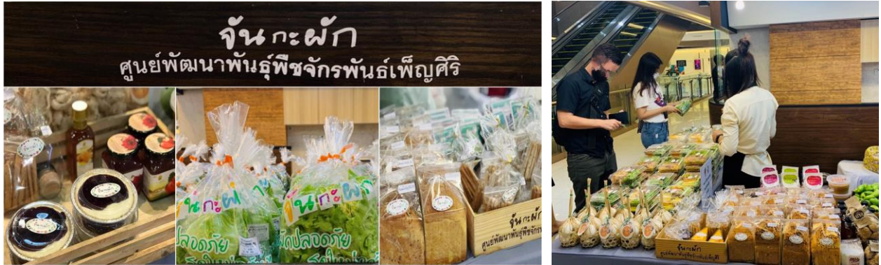
ภาพการจำหน่ายสินค้าและผลิตภัณฑ์ทางการเกษตรของร้าน “จันกะผัก”

จำหน่ายสินค้าและผลิตภัณฑ์ทางการเกษตรที่ได้จากการเพาะพันธุ์พืชผักสวนครัวจากเมล็ดพันธุ์พระราชทานฯ ในโครงการ “บ้านนี้มีรัก ปลูกผักกินเอง” ที่สนับสนุนให้เกษตรกรปฏิบัติตามหลักเกณฑ์และข้อกำหนดในการปลูกพืชผักสวนครัวที่ปลอดภัย และมีคุณภาพ ภายใต้มาตรฐาน Good Agricultural Practice (GPA) เพื่อส่งเสริมสินค้าและผลิตภัณฑ์ทางการเกษตรพื้นบ้าน พัฒนาเศรษฐกิจชุมชนท้องถิ่น รวมถึงการสร้างคุณภาพชีวิตที่ดีให้กับเกษตรกรอย่างยั่งยืน